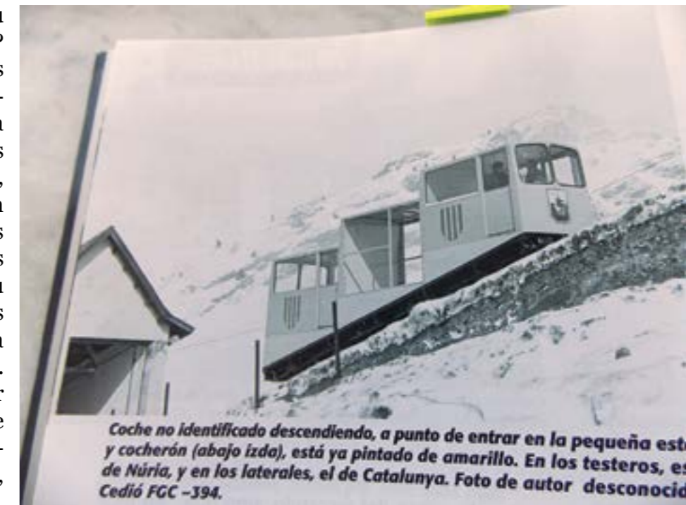
Coche no identificado descendiendo, a punto de entrar en la pequeña estación y cocherón (abajo izda), está ya pintado de amarillo. En los laterales, es de Núria, y en los laterales, el de Catalunya.

Però Núria no s'acaba aquí. A Núria també hi ha tren, com sabeu: el conegut ferrocarril de cremallera, que us hi porta des de Ribes de