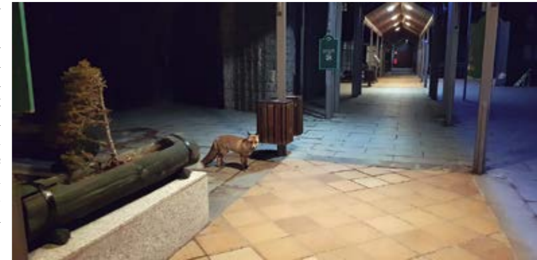
La guilla davant el Santuari

tocar, i es convertia, dins de l'agenda programada dels escolars, en un espectacle sense programar. M'han dit que la van trobar morta pels voltants del llac. Potser una mala digestió. ♦