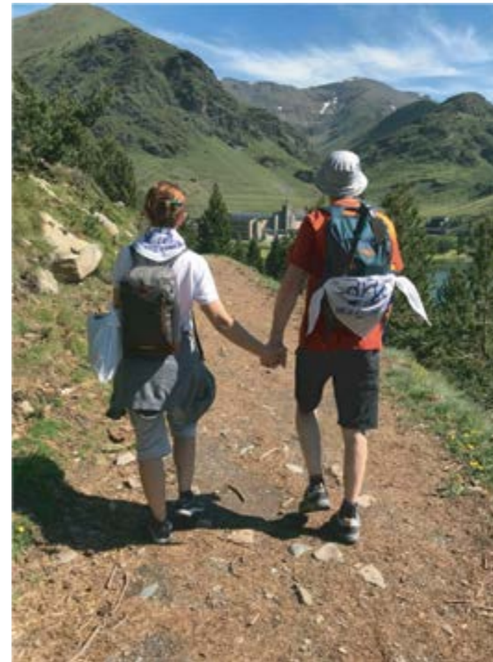
Hem compartit la nostra vida, hem fet junts UN CAMÍ junts volem arribar al Santuari de la Mare de Déu de Núria. Fotografia guanyadora del Concurs Estiu 2018, realitzada per Olga Perez d'Alella