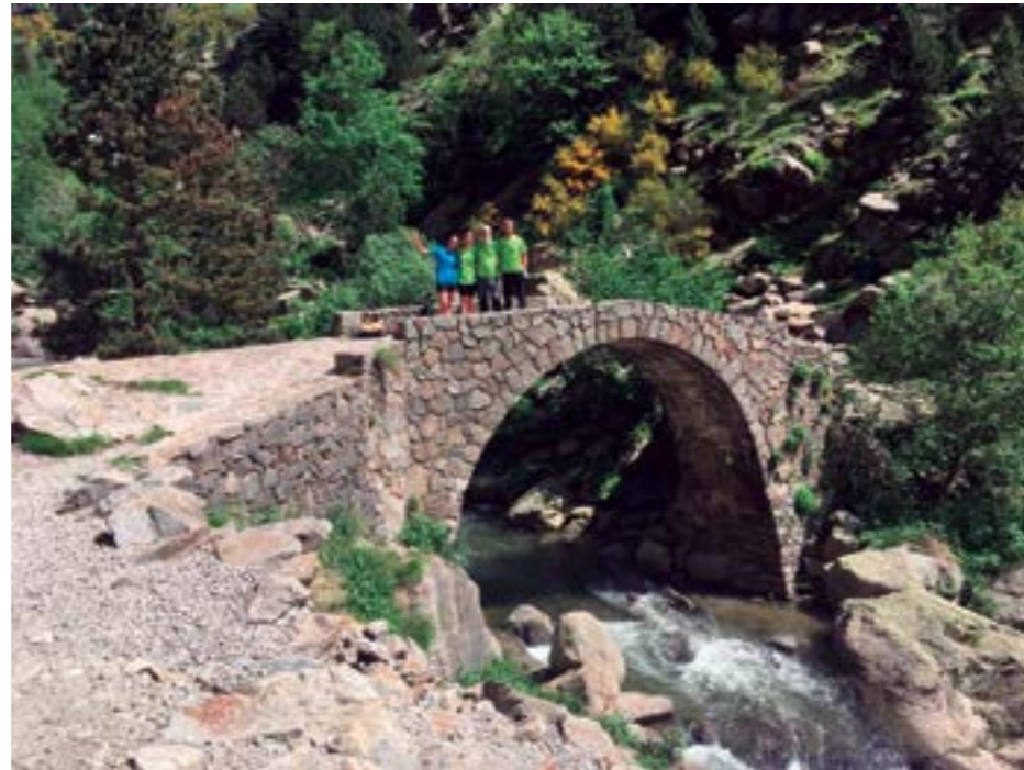
Companys i companyes del Camp d'Aprenentatge del Ripollès

El cremallera, però, no ho és tot. Els camins que els pelegrins recorren, com seria el de Núria, són camins amb significat, plens de memòria i de rituals de les generacions que ens han precedit per aquell mateix camí. Tot gaudint de la contemplació de les muntanyes hi penso, i de tant en tant, quan em creuo amb algú que baixa, ens animem a conversar amb un esperit